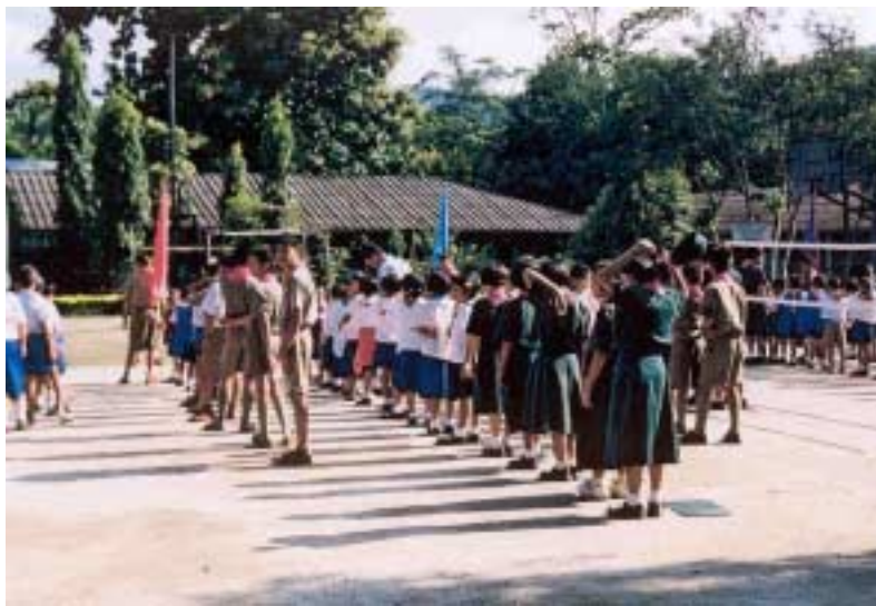
Abb. 6: Der Morgenappell

Bevor wir jedoch in die Klassen gehen konnte, mussten sich alle Schüler zum Morgenappell