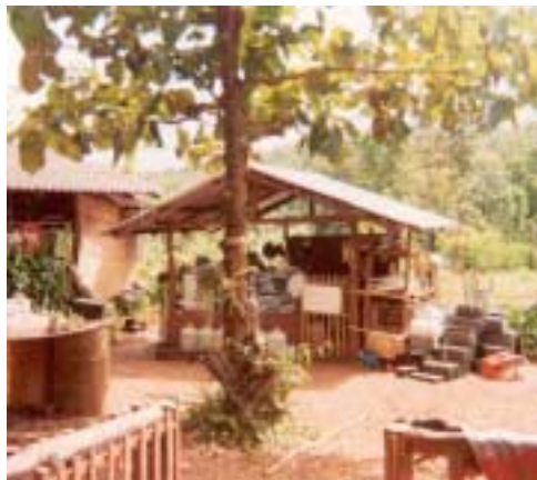
Abb. 5: Unsere Küche

Die Einheimischen essen zum Frühstück, was wir gewöhnlich zum Abendessen haben, Pfannengerichte mit viel Fleisch, viel Gemüse und natürlich viel Reis, am liebsten den