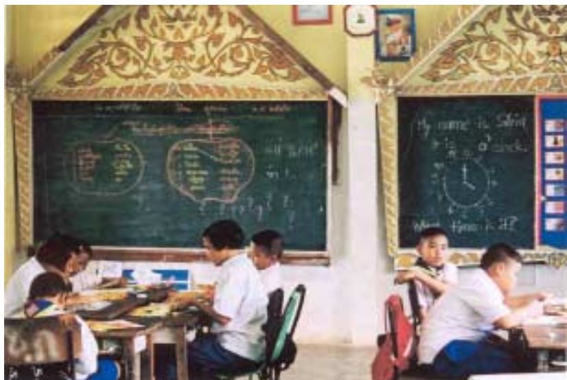
Abb. 7: Englischunterricht

In der 4. Klasse, in der ich hospitieren durfte, gab es nur 10 Schüler. Der Unterricht war zu meiner Überraschung nicht in frontaler Form, wie ich es erwartet hatte. Dies lag meines Erachtens wohl an der Lehrerin, die sich entsprechend ihrer begrenzten Mittel sehr viel Mühe gab, den Unterricht für die Kinder interessant zu gestalten. Nachdem ich mich in der Klasse vorgestellt hatte, durfte ich auch spontan die Englischstunde übernehmen.