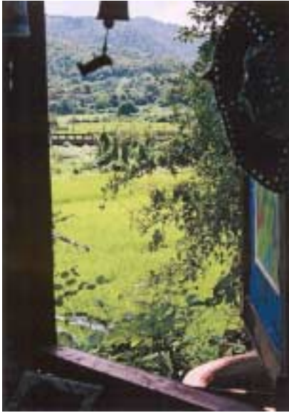
Abb. 8: Ausblick aus dem Klassenzimmer

Was ich außerdem als durchaus angenehm empfunden hatte war, neben dem grandiosen Ausblick, dass während des ganzen Vormittags die Türen aller Klassen geöffnet blieben.