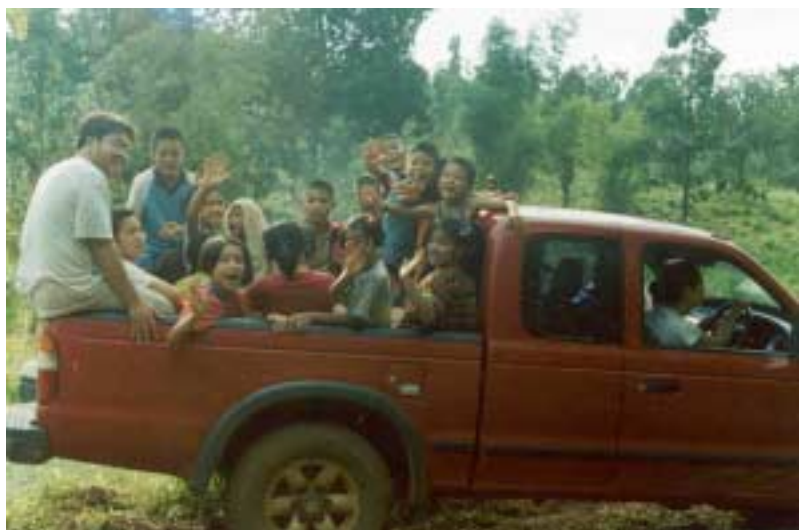
Abb. 2: Ausflug mit dem Pickup

Bis alle Bauvorhaben, insbesondere die für die geplante „Schule des Lebens“ abgeschlossen sind, besuchen die meisten Kinder die Dorfschule in Pongkum, die später genauer beschrieben wird. Dorthin werden sie für gewöhnlich, d.h. wenn es das Wetter erlaubt, mit dem Pickup gebracht. Bei Regen wird mit dem nicht ganz so geräumigen School-for-life Auto gefahren.