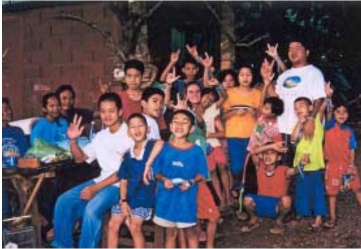
Abb. 3: Die Kinder und ich

Wie oben bereits erwähnt, wohnen 18 Kinder auf der Farm. Sie kamen alle aus unterschiedlichen Verhältnissen und aus unterschiedlichen Gründen auf die Farm. Viele stammen aus sehr ärmlichen Verhältnissen, sind von ihrer aidskranken Mutter verlassen worden, nachdem der Vater verstorben war oder sind Kinder burmesischer Flüchtlinge, die dem totalitären Regime dort enttrinnen wollten, deren Zukunft in Thailand jedoch alles andere als sicher ist.