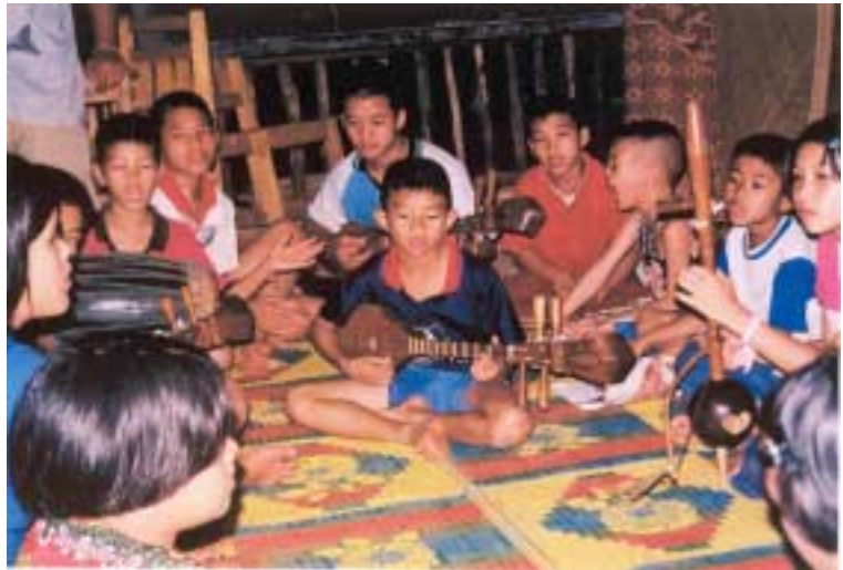
Abb. 9: Abendliches Musizieren

Später fuhren wir beispielsweise zu den heißen Quellen ins Dorf, was den Vorteil hatte, dass sich die Kinder alle gründlich mit warmem Wasser waschen konnten (auf der Farm gab es nur kaltes) oder es wurden Lieder gesungen, was die Kinder für ihr Leben gern machten, genauso wie das Spielen der traditionellen nordthailändischen Instrumente.