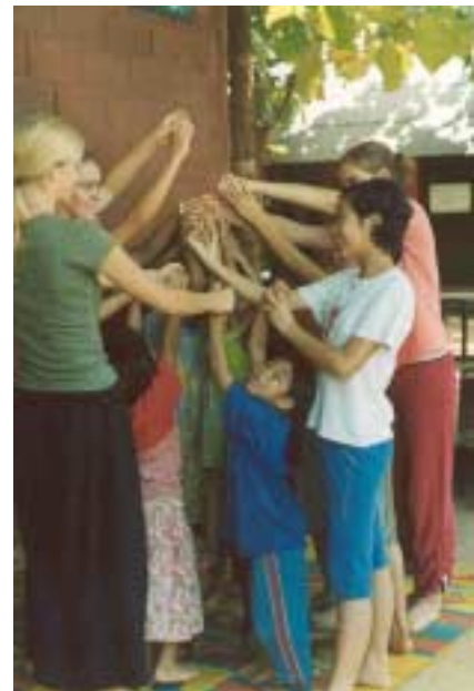
Abb. 4: Der „Hokey Cokey“

Eine Möglichkeit, ihnen die englische Sprache näher zu bringen, war, mit ihnen zu singen und zu tanzen.